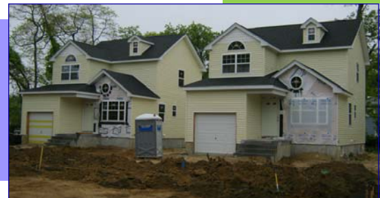
Roosevelt, New York

Proyectos de viviendas a buenas precios están ocurriendo por todo el Condado de Nassau. Miembros del consorcio del Condado De Nassau están adquiriendo propiedades que están en malas condiciones y renovándolas para poder crear viviendas en buenas condiciones y a precios razonables. El proyecto Roosevelt Scattered Site esta en plena construcción. Seis casas nuevas serán completadas para el verano 2011 y serán vendidas en una lotería diseñada para personas de bajo y moderado recursos que compran por primera vez.