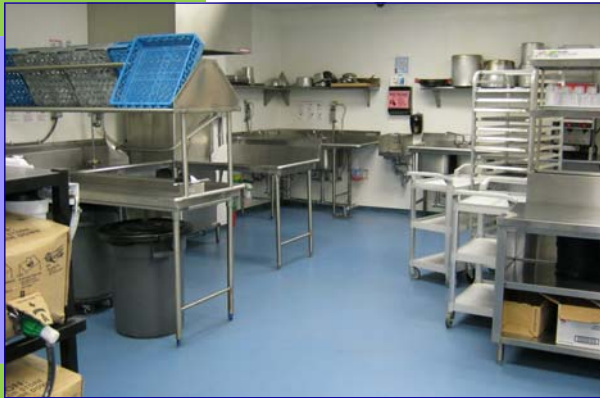
Cocina de última tecnología