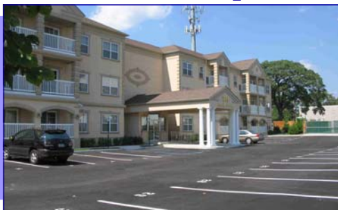
Elmont Complejo de Edad de Oro