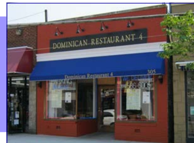
Restaurante Dominicano de Farmingdale

El Ejecutivo del Condado, Ed Mangano, apoya el programa de renovación del ficio comercial que se lleva a cabo por muchos de los miembros del consorcio. Mejorar la condición de los edificios comerciales del Condado de Nassau es algo muy importante que se continua usando fondos del CDBG. El estado deteriorado de algunas propiedades comerciales es un impedimento para el desarrollo económico y la revitalización del centro. Muchos miembros del consorcio apoyan las renovaciones de los edificios con otros fondos para instalar rótulos atractivos, ladrillo, pintura y luces para embellecer nuestras áreas comerciales.