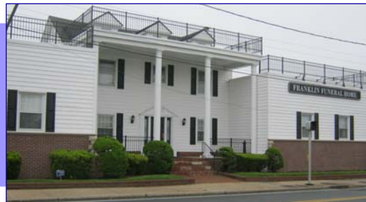
Funeraria Franklin de Franklin Square