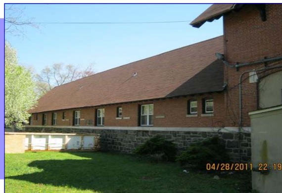
Jones Manor después de la renovación