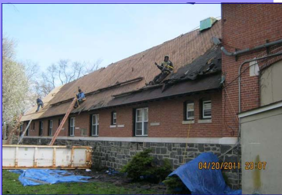
Jones Manor antes de la renovación