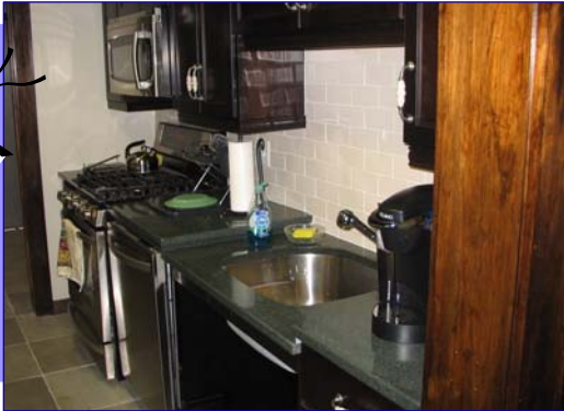
Bellerose altos nuevo centro de cocina