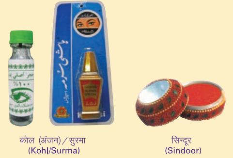
कोल (अंजन)/सुरमा (Kohl/Surma)