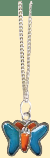
کلے کا بار