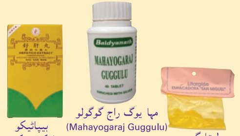
مہا یوگ راج گوگولو (Mahayogaraj Guggulu) ایکسٹریکٹ (Hepatico Extract)